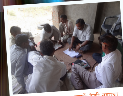
सराड़ा में परबु का वसनऊँ केणी बणावा का वाते उत्साहित वेता तका वटा का मनक