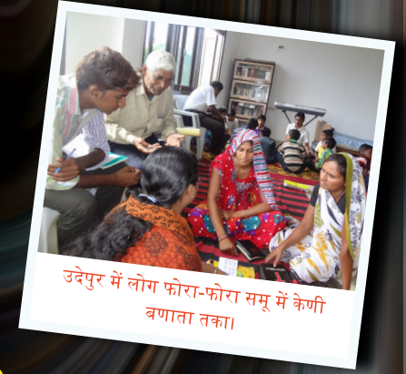
उदेपुर में लोग फोरा-फोरा समू में केणी वणाता तका।

मई का मीना में सराड़ा में पास्टर कालेव मसी जी की मण्डली में दो दन की केणी की सबा किदी गी ही, जिंमें पास्टर हमेत 27 विस्वास्याँ भाग लिदो हो। जिंमें वणा 7 केण्यौं अन 4 गीत वणाया हा। वसन हिकबा को यो तरिको वाँका वाते आसिसमय रियो।