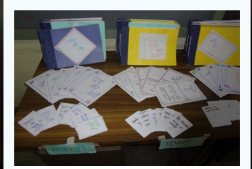
सी.वी.एल की सबा में त्यार किदी तकी चिजाँ

मण्डळी पे आदारित साक्सरता को काम को उद्देस ओ हे के, मण्डळी में यच्चौं कुई विस्वासी हे, जो भणवो-लिकणो ने जाणे हे, विने भणायो जावे। जणीऊँ वो फराटाबन्द बाइबल भणे अन हमज सके। अणी भणई को फायदो ओ हे के, यो अटा की मण्डळी का वणा मनका ने दिदो जा सके जो पाच्छा खुद मण्डळी में जान ईको फायदो दूजा लोगौं ने दे सके अन अनभण्यौं मनकाँ ने भणा सके। ईका वाते पेली दाण एक हप्ता की सबा मेवाड क्षेत्र में किदी गी, जिंमें राजस्तान की च्यार भासाऊँ आया तका मनकाँ ने वसन आदारित भणई की चिजाँ बणाणो हिकायो ग्यो। अबाणू माँ वागड़ी अन मेवाड़ी भासा में यो काम सुरु करबा की ओजणा बणई हे।